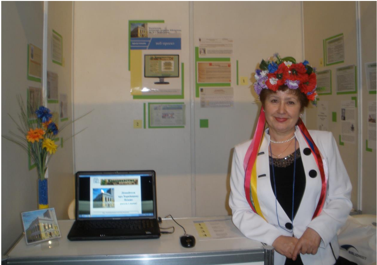
Учасниця Ярмарку інноваційних бібліотечних послуг та електронного врядування. Центр ділового і культурного спілкування «Український дім». м. Київ, квітень 2011 р.